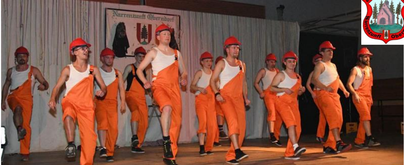
Im Jahr 2017 trat die Gruppe nicht nur bei den NZO-Veranstaltungen, sondern auch erstmalig Auswärts auf.