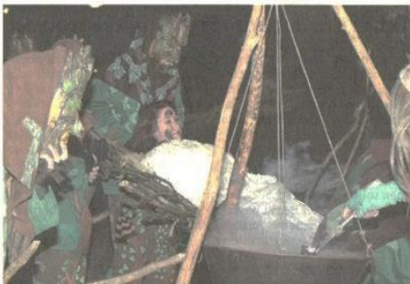
Der Dannaröa-Schrädl entführt ein Mädchen aus dem Dorf, um es hinterher in einen Schrädl zu verwandeln.

So setzte Eipper sich hin, und ersann ein Märchen. „Es ging ja